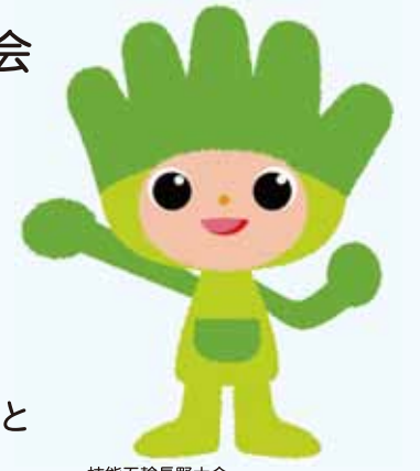
技能五輪長野大会 公式キャラクター わざまる

ただ今長野県では、「第48回技能五輪全国大会 かながわ2010」の参加者を募集しています。