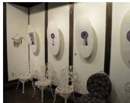
店舗1Fのディスプレイ