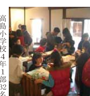
高島小学校4年1部32名とMitoraが共催するイベントで、4年1部が夏に上諏訪駅周辺で行ったアンケート調査の結果を受け、人通りの少ない駅前には賑わいをつくり、街を元気にしようという活動を行っています。将棋・ペーゴマや粘土遊び、折り紙などの懐かしい遊びを町の方々や賑やかに楽しみました。

したら恩返しができるのか。その小さな試みとして「よそ者」の私が感じる諏訪の魅力、少しでもご紹介できればと、情報紙を発行しています。今回、会議所ニュースの紙面をお借りしてその一部を紹介いたします。