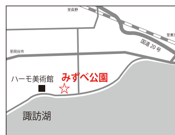
天候の良い日、下諏訪町のみずべ公園から諏訪湖を望むとその先に八ヶ岳と富士山を望むことができます。