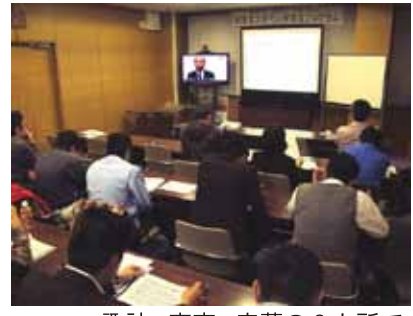
諏訪 - 東京 - 室蘭の3カ所で同時に授業が行われている。

製造業の次世代リーダーの養成を目指し、当所は、法政大学大学院、信州大学、室蘭工業大学と連携し、ビジネススクール(エッセンスコース)を昨年11月25日に開講した。諏訪会場の受講生は25名で、自社の発展から地域製造業発展に向けて、今年度計12回の講義を行う。 講義は、当所の会議室で遠隔講義システムを活用して、東京・北海道・長野県を結び進めていく。 今回の事業は国の人材育成プログラムの一環で、次年度以降は、各大学が独自の事業として継続発展させ、地域製造業の活性化に貢献する予定となっている。