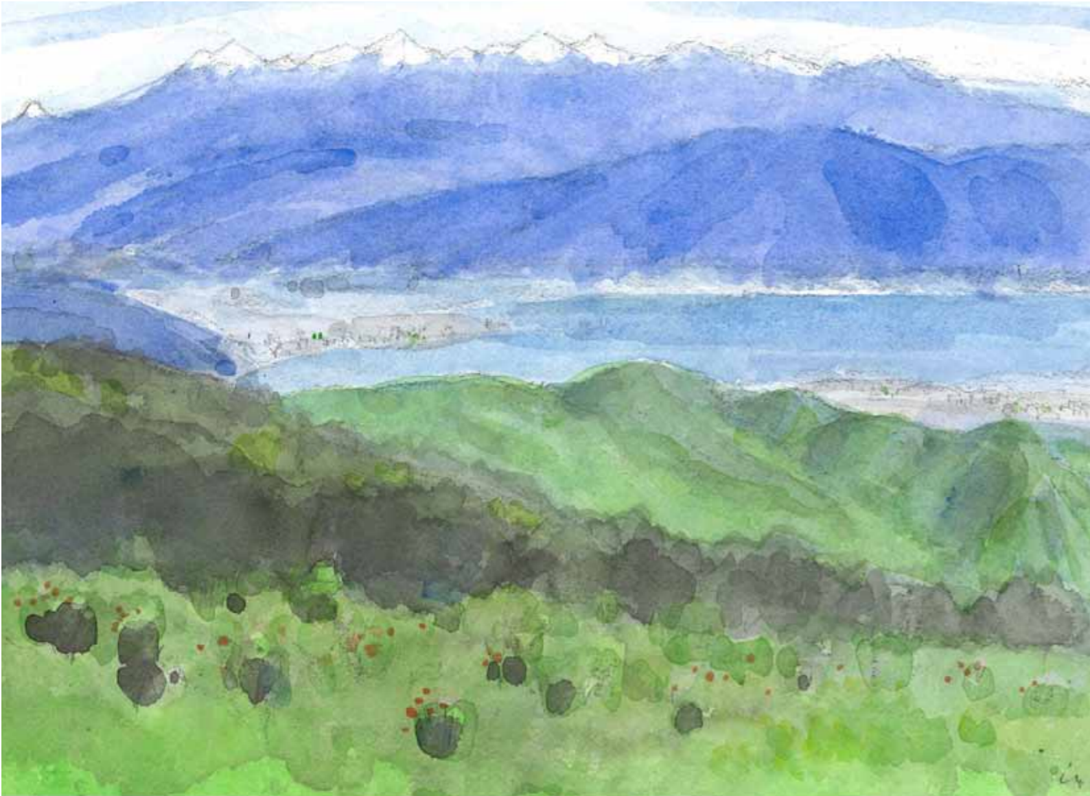
「諏訪湖を遠望」 水谷 心

2013May Vol.383 http://www.suwacci.or.jp/ info@suwacci.or.jp