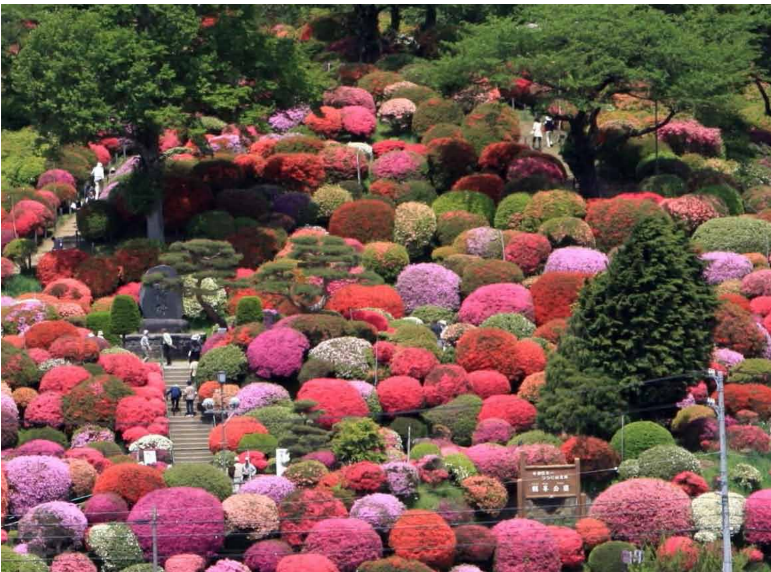
撮影場所:岡谷市鶴峰公園