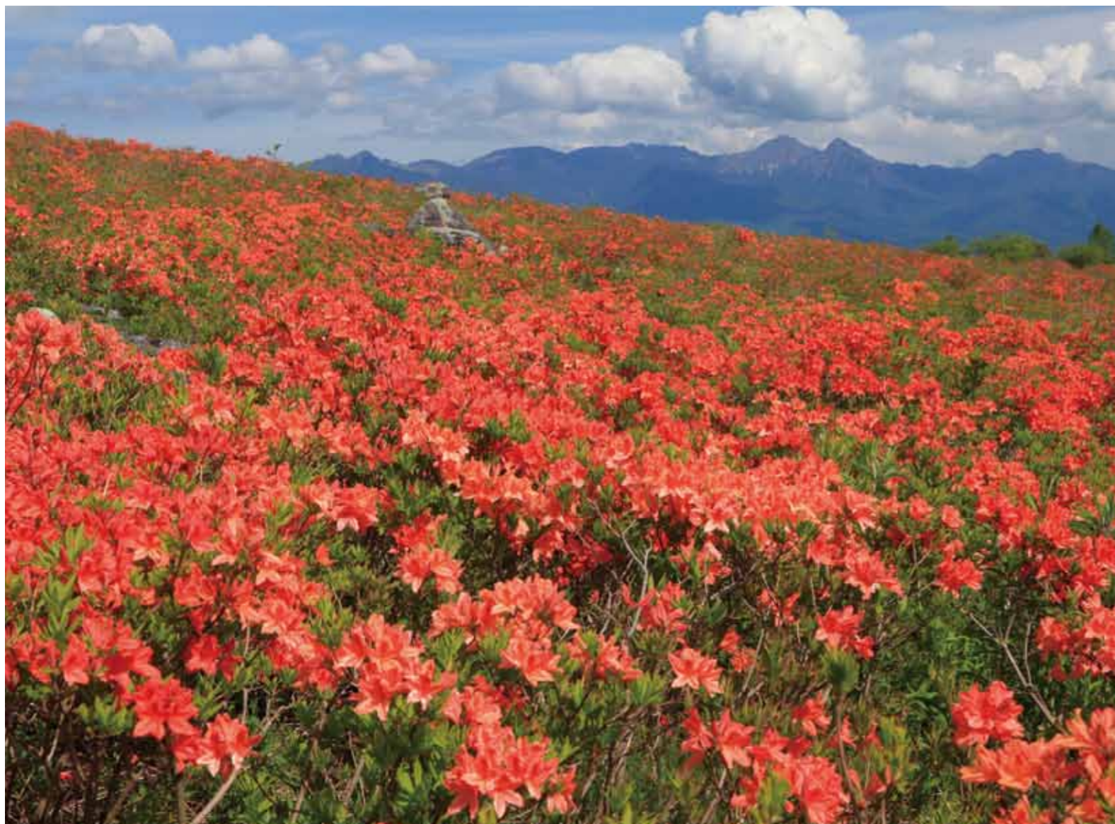
撮影場所:霧ヶ峰 レンゲツツジ