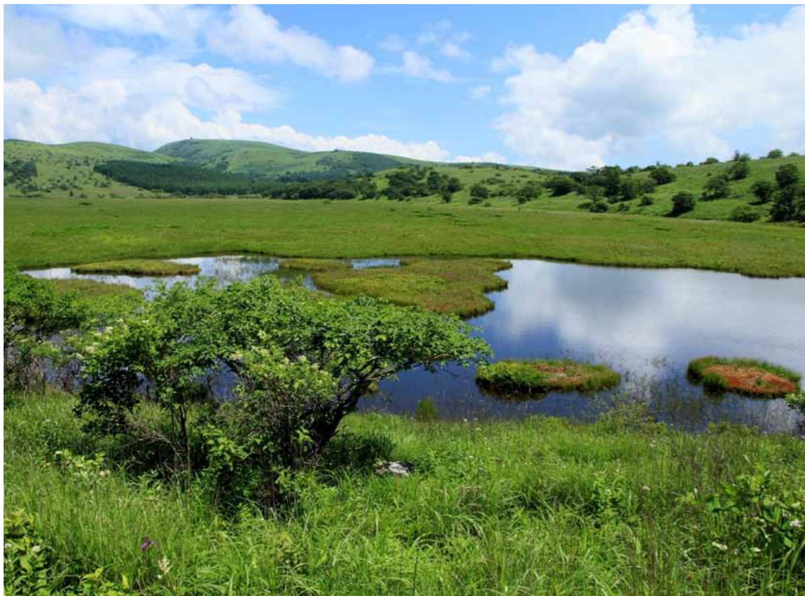
撮影場所:八島湿原