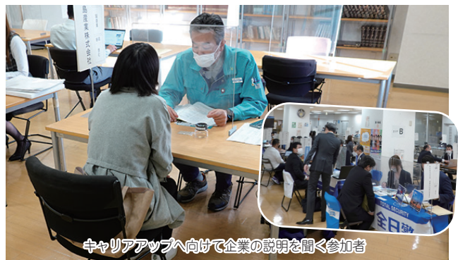
キャリアアップへ向けて企業の説明を聞く参加者

諏訪地域の雇用対策事業としてイルプラザ(岡谷市)で開催しました。転職者や移住希望者などの採用意欲がある事業所106社が参加し、求職者と就職へ向けた面談を行いました。