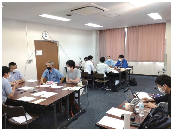
6/17 日中堅社員・職場リーダー研修会 (受講者 対面9名、オンライン16名)

実はこの話、農業ではなく先日開催した「中堅社員・職場リーダー研修会」を受講したスタッフさんの経営者さんとの会話の中で出た言葉なのです。その経営者さんは、スタッフさんに受講させる理由を「経営も同じで、ちゃんとした土壌を作ればちゃんとした収穫物が取れるということ」とわかりやすく説明してくれました。そして経営者さんは「手段と目的」の関係性について説明してくれました。