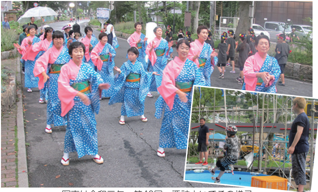
写真は令和元年 第40回 諏訪よいてこの様子

諏訪市民に親しまれております「諏訪よいてこ」は、本年の「中止」を実行委員会において決定いたしました。 市民の皆様、ご協賛いただいている企業の皆様、運営にご協力いただいている関係者の皆様には、深くお詫び申し上げますとともにご理解を賜りますようお願い申し上げます。