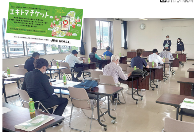
エキトマチケットについて説明を受ける商連役員