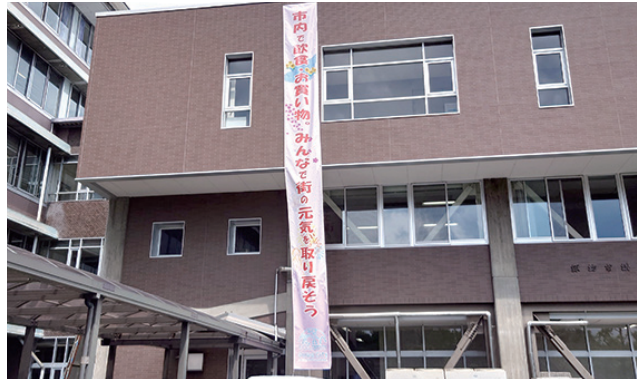
諏訪市役所議会棟に掲示

当所と諏訪市は、コロナ禍で疲弊している市内飲食・商店の振興へ向けて、市役所議会棟へ懸垂幕を掲げました。 SUWAおひきたてクーポン券を利用しながら、ぜひ地域のお店で飲食やお買い物を楽しみましょう。