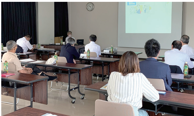
セミナーを聴講する参加者

諏訪法人会諏訪支部は、定期総会を開催し、併せて税務研修会を行いました。研修会では、諏訪税務署の担当者から相続税脱税の報道記事などを参考に、査察官としての経験に基づいた事例を紹介いただきました。