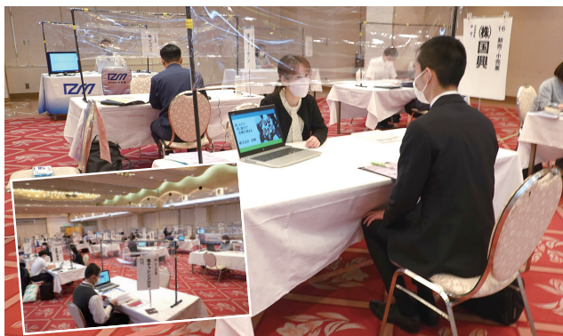
熱心に説明を聞く学生