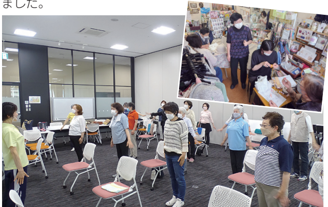
(下) 健康体操を楽しむ参加者 (上) 講師に教わりながら編み物を作る参加者

諏訪市内のお店の方が講師となり、プロならではの技術や専門知識を無料で学べるまちゼミを開催しました。 参加者は、知らなかったお店や気になっていたお店へ気軽に参加でき、次回の来店へとつながる取り組みとなりました。