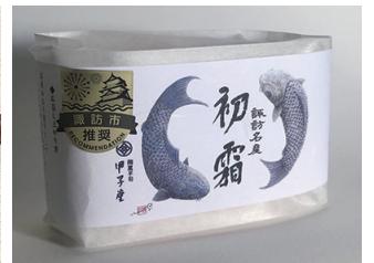
諏訪市推せんみやげ品に認定された「初霜」5個入り