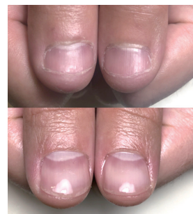
④ 深爪が改善する様子

ネイルをしているか分からないような自然な仕上がりにもできるため、男性のお客さまもいます。二枚爪で悩んでいた介護職の方は、『服にひっかかって爪が折れてしまうこともなくなり、前よりもぐっと握ることができるようになった、爪があると力が入りやすくなった。もっと早くやればよかった。』と感想をいただきました。