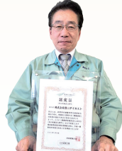
(株)豊田ダイカスト様