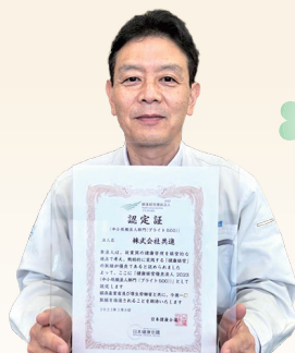
(株)共進様 プライト500