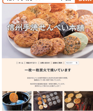
完成した EC サイト