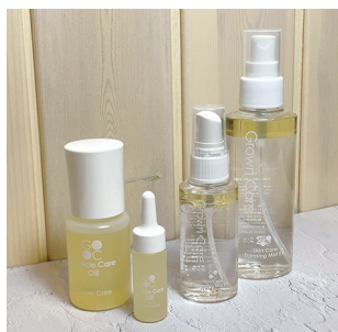
④ 販売もしている保湿用品保湿だけでも深爪は改善します