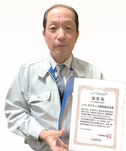
スワテック建設(株)様