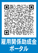
雇用関係助成金ポータル

受付から通知まですべてシステム上で行うことができ、事業主等の利便性向上等が図れます。