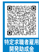
特定求職者雇用開発助成金

雇用調整助成金、産業雇用安定助成金、特定求職者雇用関係助成金については雇用関係助成金ポータルでの電子申請の対象外となります。それぞれQRコードより申請をお願いします。