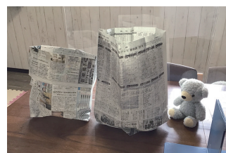
新聞紙で作るゴミ入れ