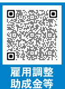
雇用調整助成金等