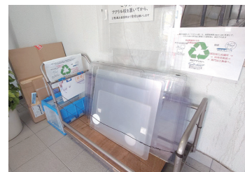
日本商工会議所発行「会議所ニュース」に本事業について掲載されました

諏訪商工会議所(長野県)は6月14日から7月13日まで(平日)、会員企業の店舗や事業所などに設置されていた新型コロナウイルスの飛沫感染防止用のパーテーション(アクリル板)を無料で回収する。新型コロナウイルスの感染防止の位置付けがなくなり、不要になったアクリル板の処分に関する相談が増えたことから、会員サービスの一環として実施。また、同所市の「ゼロカーボンシティ宣言」に賛同しており、廃棄物を削減して循環型社会の実現に寄与したい考えだ。 回収したアクリル板は、地元の事業者を通じてリサイクル事業者に引き渡し、さまざまな製品に生まれ変わることとなる。アクリル板の回収は同所の持ち込みで、事前申し込みは不要。アクリル板をリサイクルすることで、同所は、同市が「環境に配慮した経済活動を展開しているまち」であることを発信していきたくと話している。