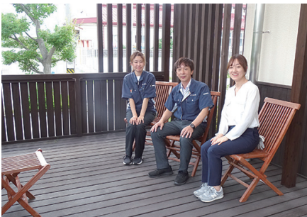
福利厚生の一環で設置したウッドデッキ

また、社員は労働力ではなくて一緒に過ごす仲間や家族だと思っています。生活の中で一番長く過ごす働く時間を、人間関係や環境面で居心地よくするのが私の役目だと思っています。難しいことですが、私が忘れたくないと思っていることの一つです。