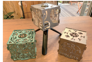
試作品のランプシェード