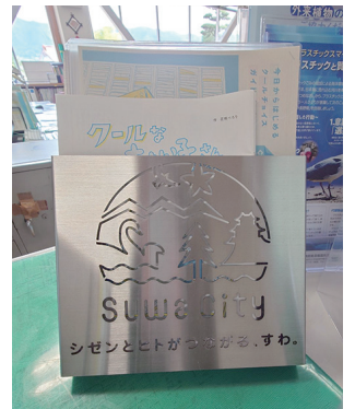
諏訪市政80thに80個寄贈

諏訪地域への若手人材の定着や、地域経済の発展のために一企業として頑張っていきたいです。