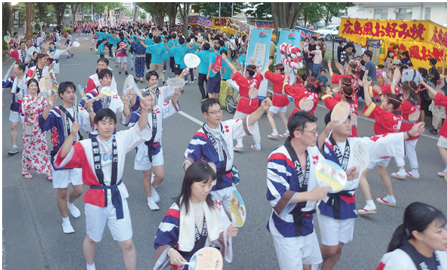
踊りを楽しむ参加連の皆さん

景況厳しい中、会員事業所様より多大なるご協賛金を賜り、心より御礼申し上げます。また、ご協力いただいた会場周辺の事業所様、運営に携わっていただいた事業所様、誠にありがとうございました。