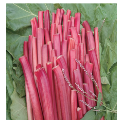
梱包前の鮮やかな赤色のルバーブ

養蜂は現在勉強中ですが徐々に蜂の数を増やして、いずれは栽培しているルバーブとはちみつでジャムを作りたいと思っています。これからも皆さんを笑顔にできる仕事をしていきたいと思っています。SNSでの発信にも力を入れているのでぜひご覧ください!