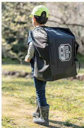
子供でも背負うことができ、水にも浮きます

今年は近代日本に未曾有の被害をもたらした関東大震災から、100年の節目に当たります。災害対策の啓発として震災の発生日である9月1日が「防災の日」と定められています。